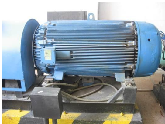
Vista de Motor de 450 HP